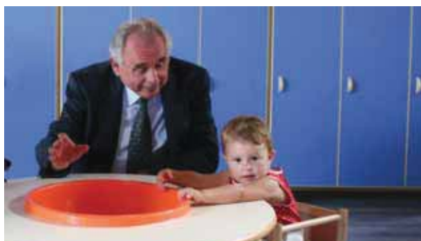
Il Presidente Modena con una bambina all'interno del nuovo asilo