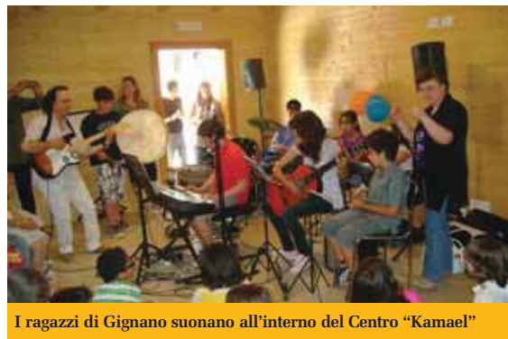
I ragazzi di Gignano suonano all'interno del Centro "Kamael"